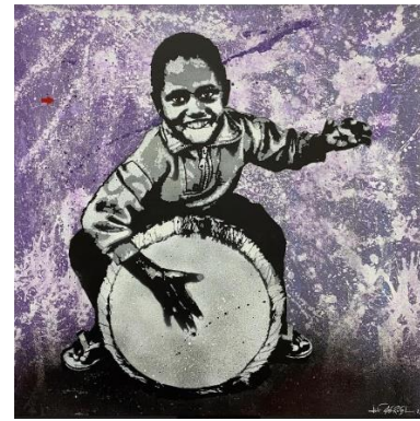
Djembe Kid , Jef Aérosol 2021, 100x100 cm