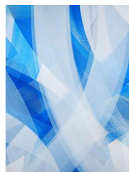
Gesture vs Line #63, Romain Froquet 2021, toile, 100x73 cm