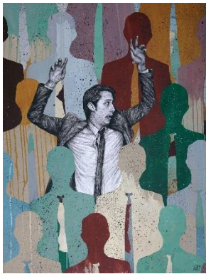
Freak out , Levalet 2020, panneau de bois, 100x81 cm