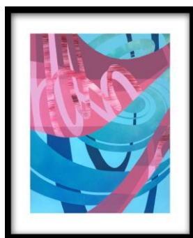
The waves, LADY M 2020, sur papier, 65x50 cm